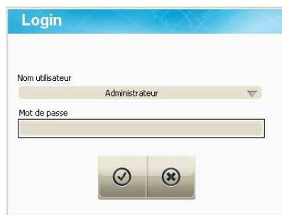
Configuration (accès sécurisés)