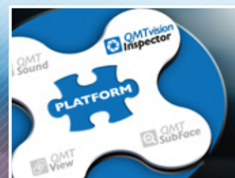
Produit issu de la plateforme QMT

La QMTInspect-C s'intègre dans la gamme de machines de tri QMTInspect pour le cas de pièces longues. La QMTInspect-C comprend une station de vision avec une caméra verticale, en option une deuxième caméra verticale ou inclinée permet le contrôle de pièces très longues ou la rectitude. Le principe de