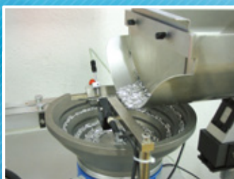
Alimentation automatique des pièces par bol vibrant