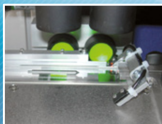
Des systèmes télécentriques pour des précisions de mesure élevées